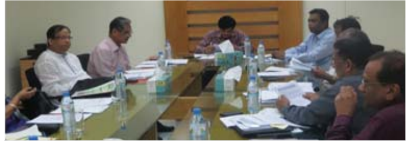
সম্প্রতি অনুষ্ঠিত বুরো বাংলাদেশের গভর্নিং বডি'র ত্রৈমাসিক সভায় অংশগ্রহণকারী সম্মানিত সদস্যবৃন্দ।