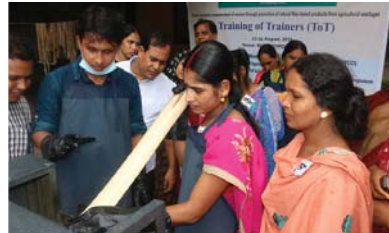
INSPIRED প্রকল্প কর্তৃক আয়োজিত প্রশিক্ষক প্রশিক্ষণে অংশগ্রহণকারীগণ প্রাকৃতিক উৎস (কলাগাছ) থেকে সূতা উৎপাদনের প্রক্রিয়া হাতে-কলমে শিক্ষা নিচ্ছেন।