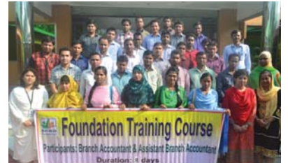
শাখা হিসাবরক্ষকদের জন্য আয়োজিত ফাউন্ডেশন কোর্সে অংশগ্রহণকারী প্রশিক্ষক এবং প্রশিক্ষণার্থীবৃন্দ