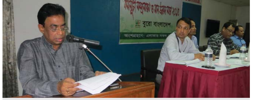
সম্প্রতি সারাদেশে সংস্থার এলাকাভিত্তিক সকল কর্মীদের অংশগ্রহণে ‘কর্মসূচী সম্প্রসারণ ও মান উন্নয়ন সভা’ অনুষ্ঠিত হয়। সভাসমূহে বিগত বছরের ফলাফল বিশ্লেষণ, এ বছরের কর্ম পরিকল্পনা এবং তা বাস্তবায়নের লক্ষ্যে করণীয় নির্ধারণ, খেলাপী নিয়ন্ত্রণ, কর্মীদের দক্ষতা উন্নয়ন এবং আরো অনেক বিষয়ে মত বিনিময় করা হয়।