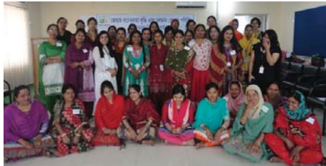
‘জেভার সচেতনতা বৃদ্ধি’ বিষয়ক একটি কর্মশালায় অংশগ্রহণকারী প্রশিক্ষক এবং প্রশিক্ষণার্থীবৃন্দ