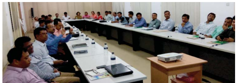
টাংগাইল প্রশিক্ষণ কেন্দ্র মিলনায়তনে অনুষ্ঠিত সমন্বয় সভায় অংশগ্রহণকারী সংস্থার বিভিন্ন পর্যায়ের কর্মকর্তাবৃন্দ